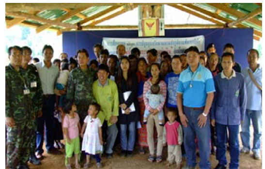
การฝึกอบรมการผลิตและแปรรูปกาแฟครบวงจร