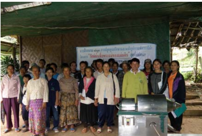
การฝึกอบรมหลักสูตรการผลิตกาแฟอาราบิก้า