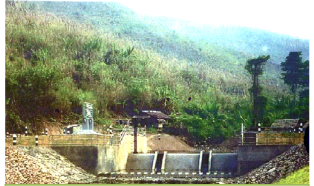
โครงการฝายบ้านหารเด็ด