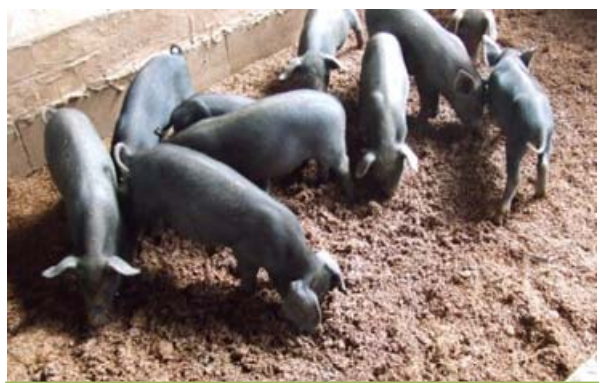
ส่งเสริมการเลี้ยงสุกร