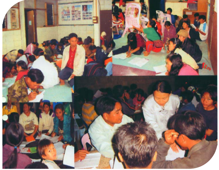
ส่งเสริมให้ราษฎรได้รู้หนังสือ