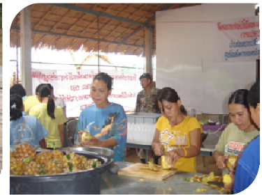
การขยายผลสู่หมู่บ้านเป้าหมาย