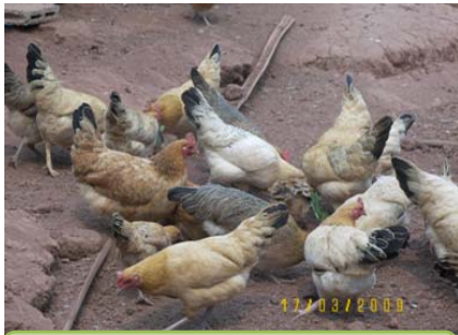
การเลี้ยงไก่ในครัวเรือน

การส่งเสริม กระบวนการเรียนรู้ พัฒนาอาชีพ ตามแนวเศรษฐกิจ