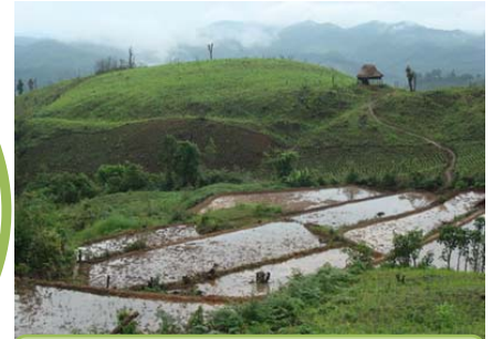
การปรับพื้นที่ทำนาขั้นบันได

การส่งเสริม กระบวนการเรียนรู้ พัฒนาอาชีพ ตามแนวเศรษฐกิจ