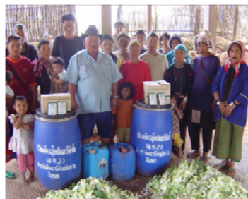
บ้านห้วยหวกป่าไซ บ้านป่าแอ บ้านห้วยหมาก บ้านเล่าลือ