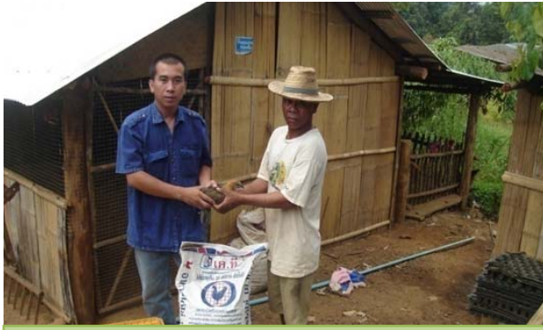
การสนับสนุนพันธุ์ไก่ให้เกษตรกร