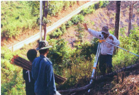
การจัดทำระบบอนุรักษ์ดินและน้ำ