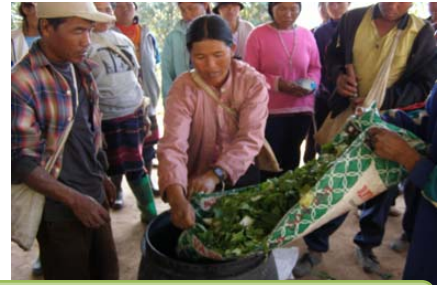
แปลงสาธิตปุ๋ยพืชสดและการผลิตปุ๋ยน้ำใช้ในครัวเรือน