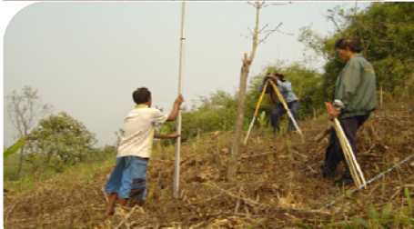
สำรวจและออกแบบระบบอนุรักษ์ดินและ