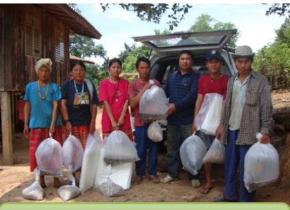
สนับสนุนพันธุ์ปลา