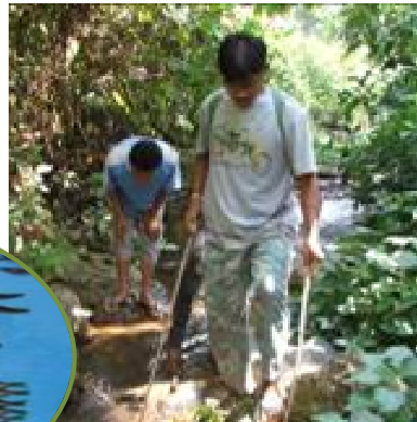
สำรวจและประเมินทรัพยากรสัตว์น้ำ