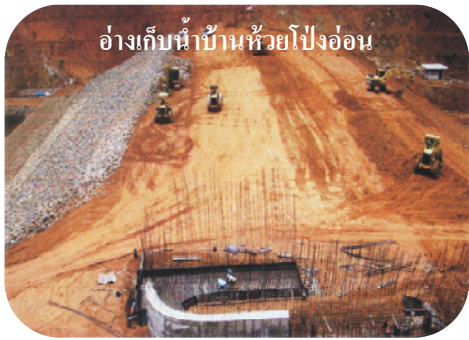
อ่างเก็บน้ำบ้านห้วยโป่งอ่อน