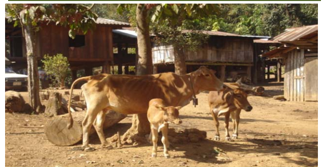
การปศุสัตว์ในครัวเรือน