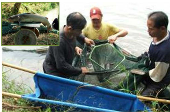
การส่งเสริมและพัฒนาอาชีพการเพาะเลี้ยงสัตว์น้ำ