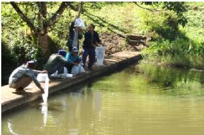
ปล่อยพันธุ์สัตว์น้ำในแหล่งน้ำธรรมชาติ