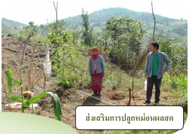
ส่งเสริมการปลูกหม่อนผลสด