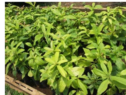
การผลิตต้นพันธุ์พืชเพื่อสนับสนุนเกษตรกร