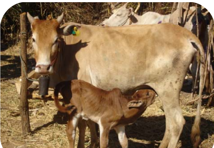
การส่งเสริมและพัฒนาอาชีพด้านปศุสัตว์