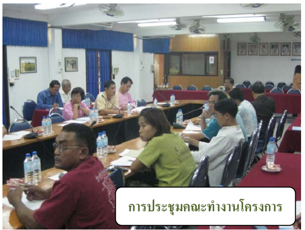
การประชุมคณะกรรมการโครงการ