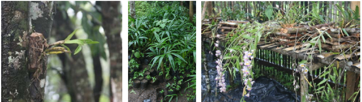
พันธุ์พืชท้องถิ่นที่บ้านห้วยหมากกลาง เช่น คาหาน ม่านสายพระอินทร์