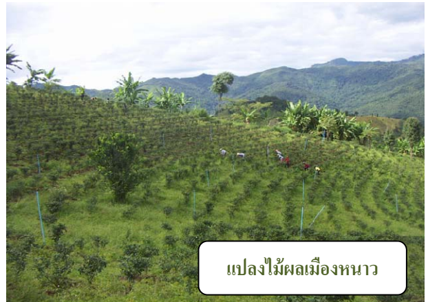
แปลงไม้ผลเมืองหนาว