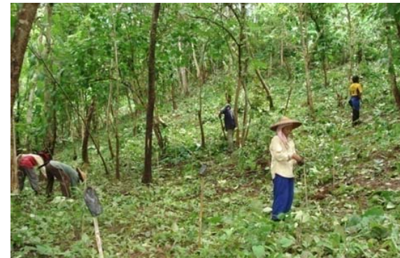
กิจกรรมปลูกไม้ใช้สอย