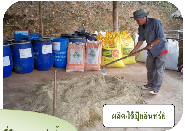
ผลิตปุ๋ยอินทรีย์