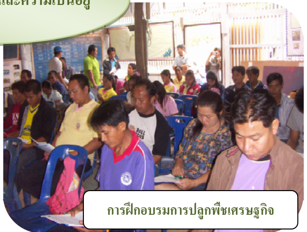
การฝึกอบรมการปลูกพืชเศรษฐกิจ