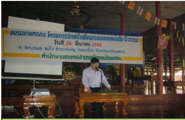
การชี้แจงวัตถุประสงค์ของโครงการรักษาน้ำฯ