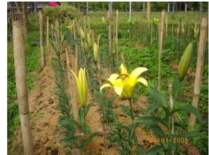
กล้วยไม้ป่าที่ได้ทำการอนุรักษ์ไว้