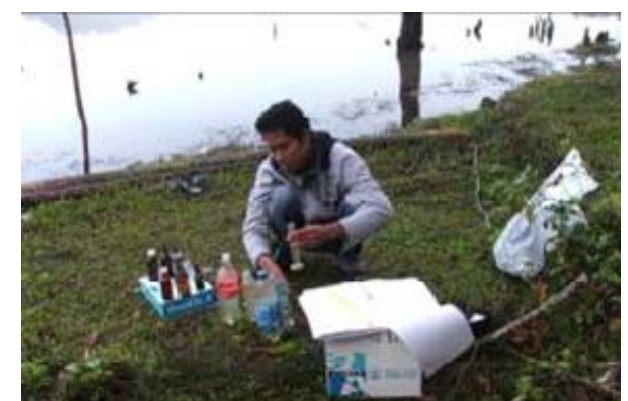
การตรวจและวิเคราะห์คุณภาพน้ำ