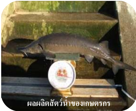
ผลผลิตสัตว์น้ำของเกษตรกร