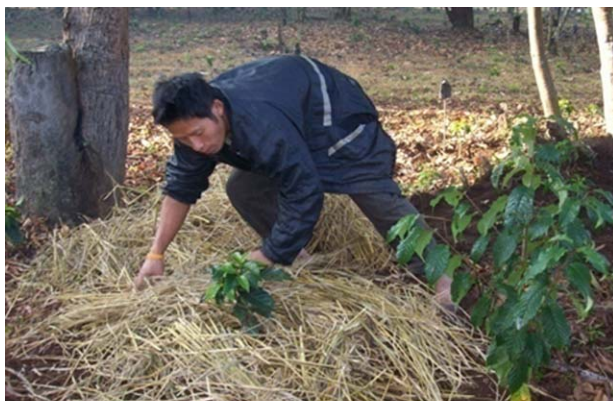
การทำแปลงสาธิตการปลูกกาแฟอาราบิก้า ในร่มเงาธรรมชาติ