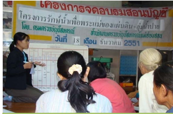
การฝึกอบรมการทำจัดบัญชี