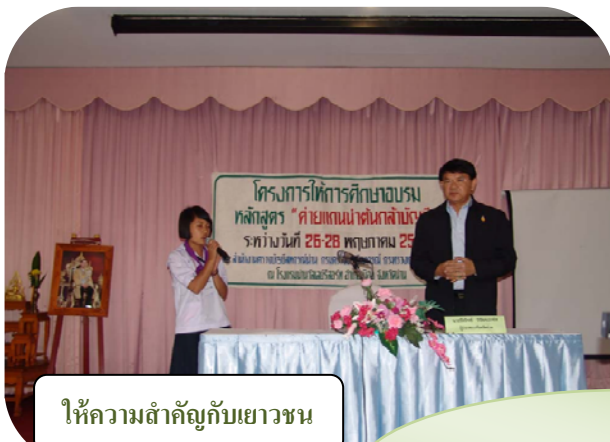
ให้ความสำคัญกับเยาวชน