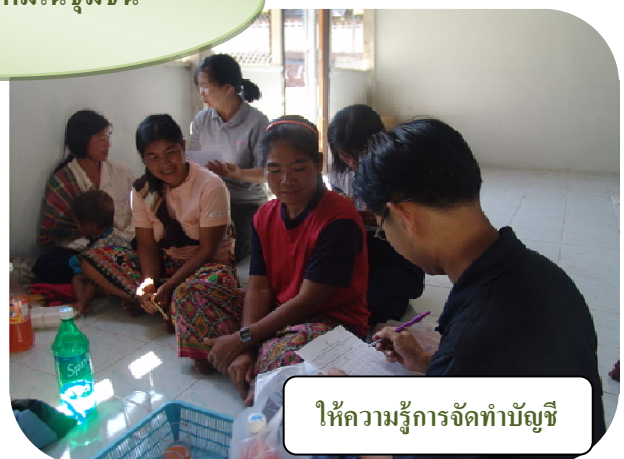
ให้ความรู้การจัดทำบัญชี