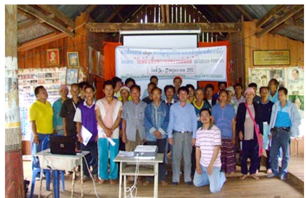
การฝึกอบรมการผลิตและแปรรูปกาแฟอาราบิก้าครบ วงจร