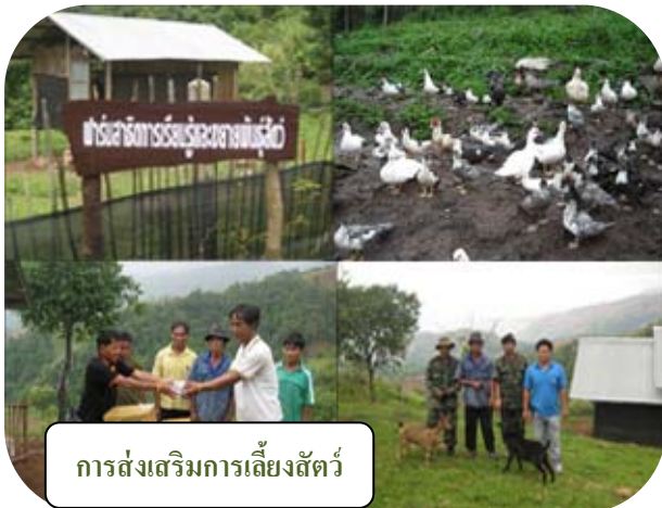
การส่งเสริมการเลี้ยงสัตว์