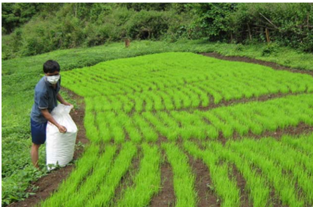
ใช้ยาสูบหวานแปลงข้าวเพื่อป้องกันแมลงศัตรูข้าว