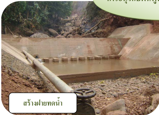
สร้างฝายทดน้ำ