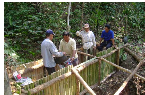
สร้างฝายชะลอความชุ่มชื้นในพื้นที่