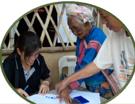
ราษฎรในพื้นที่มาเข้าร่วมการฝึกทำบัญชี