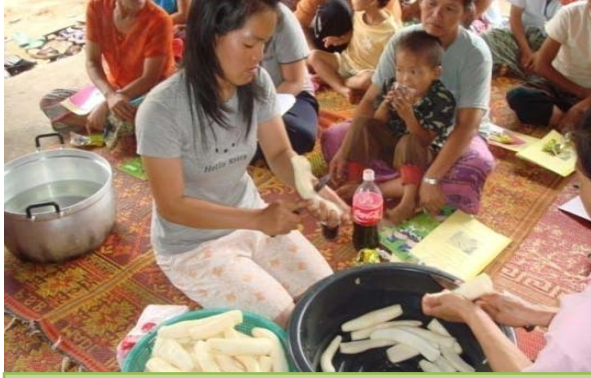
การฝึกอบรมการแปรรูปและถนอมอาหาร