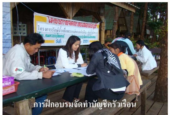
การฝึกอบรมจัดทำบัญชีครัวเรือน