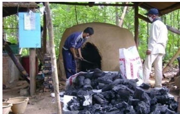
การส่งเสริมการใช้เชื้อเพลิงชีวมวล