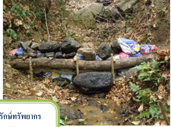
การฟื้นฟูและอนุรักษ์ทรัพยากร ดิน น้ำ และป่าไม้ เพื่อความสมดุลและยั่งยืน