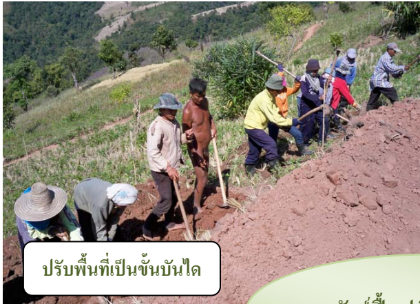
ปรับพื้นที่เป็นขั้นบันได