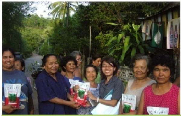
การสนับสนุนปัจจัยการผลิตแก่เกษตรกร