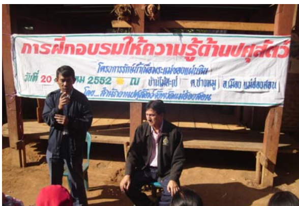
ฝึกอบรมด้านปศุสัตว์