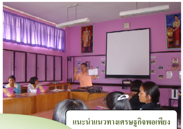
แนะนำแนวทางเศรษฐกิจพอเพียง