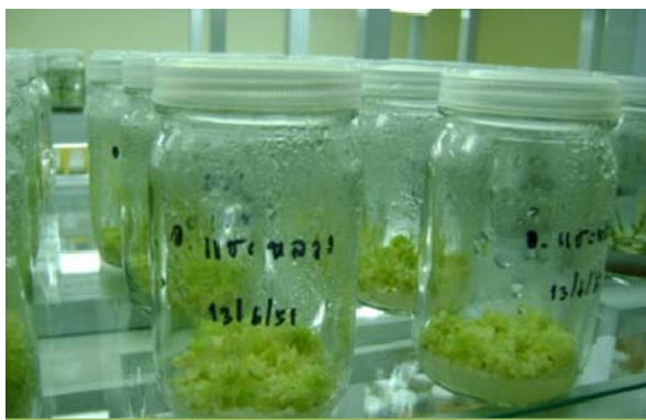
ดูแลรักษาต้นกล้าอนุบาลด้วยไม้อื้องแฉะ