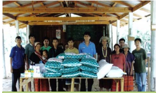
สนับสนุนเวชภัณฑ์และอาหารสัตว์ให้เกษตรกร