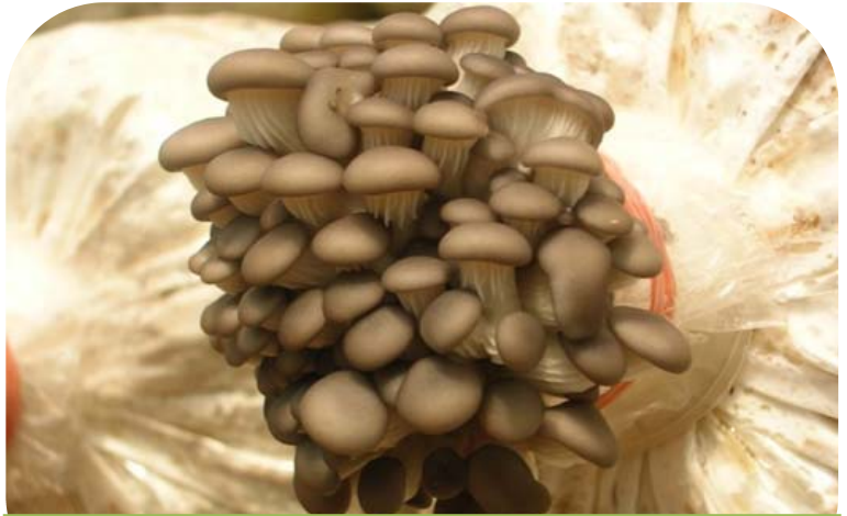
ผลผลิตเห็ดจากก้อนเชื้อที่เกษตรกรได้รับการสนับสนุน