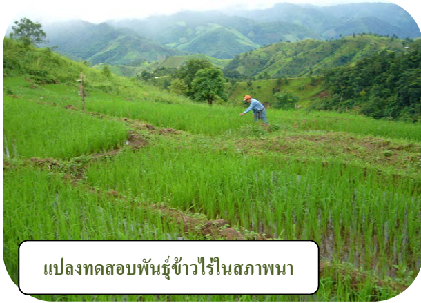
แปลงทดสอบพันธุ์ข้าวไร่ในสภาพนา