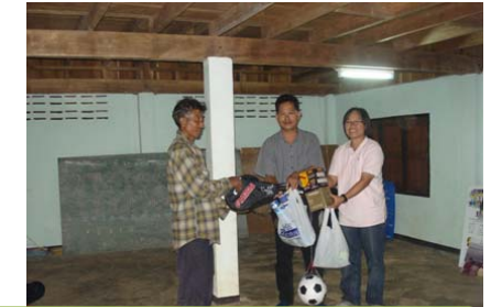
การฝึกอบรมกลุ่มแม่บ้านเพื่อแปรรูปผลผลิตทางการเกษตร และสนับสนุนปัจจัยการผลิต