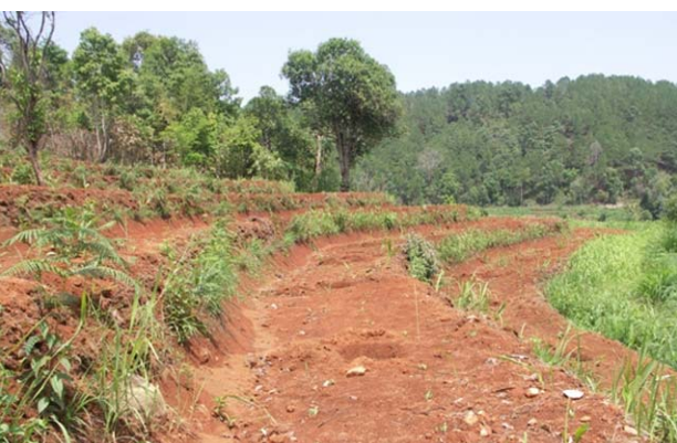
พื้นที่สำหรับปลูกท่อและอะโวคาโด