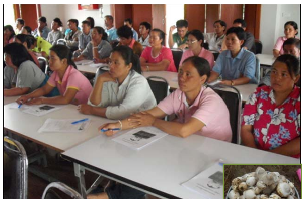
ฝึกอบรมการเพาะเห็ดฟาง