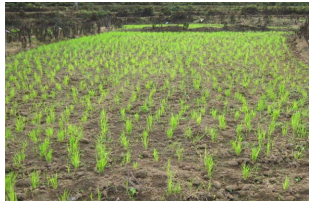
แปลงเรียนรู้การปลูกข้าว บ้านปางคอง