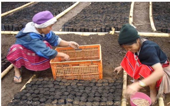
เพาะชำกล้าไม้ในโครงการ food bank