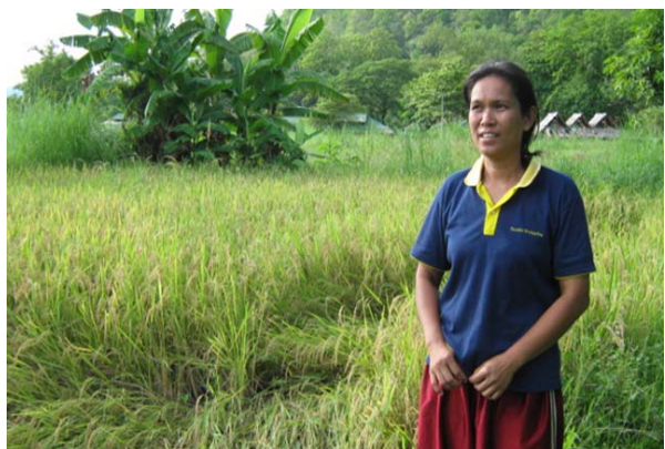
เกษตรกรเจ้าของแปลงข้าวพันธุ์ กข39