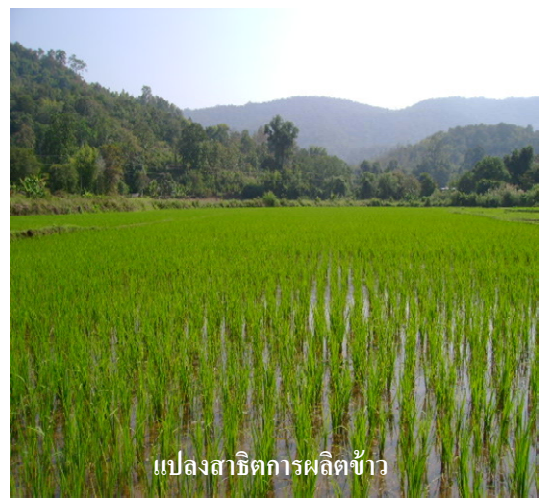
แปลงสาธิตการผลิตข้าว