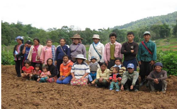
เกษตรกรที่ได้รับการฝึกอบรมการปลูกข้าว