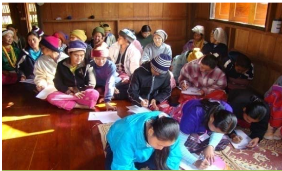
อบรมการทำบัญชีให้กลุ่มทอผ้ากะเหรี่ยง