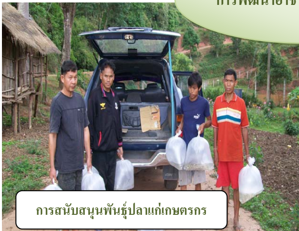
การสนับสนุนพันธุ์ปลาแก่เกษตรกร