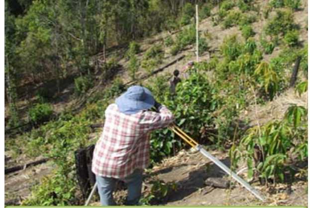
สำรวจพื้นที่เพื่อจัดทำระบบอนุรักษ์ดินและน้ำ