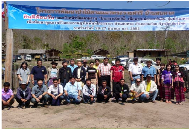
กิจกรรมโครงการพัฒนาป่าไม้ตามพระราชดำริ และการปรับปรุงพื้นที่เพื่อสามารถกักเก็บความชุ่มชื้น