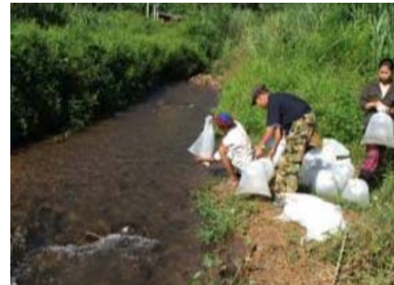
ปล่อยปลาสู่แหล่งน้ำธรรมชาติ