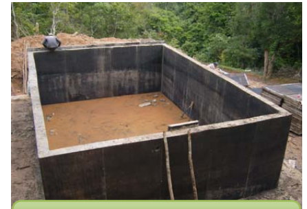
ก่อสร้างบ่อเก็บกักน้ำ

การเสริมสร้างความเข้มแข็ง และการพัฒนาคุณภาพชีวิต ของครอบครัวและชุมชน