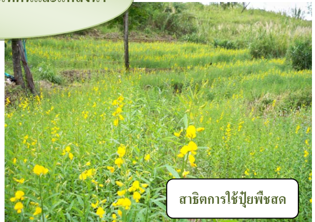
สาธิตการใช้ปุ๋ยพืชสด