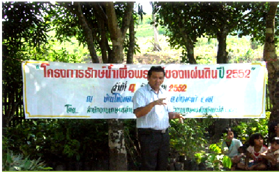
เจ้าหน้าที่ให้คำแนะนำเกี่ยวกับโครงการ