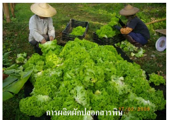
การผลิตผักปลอกสารพิษ 17/02/2009