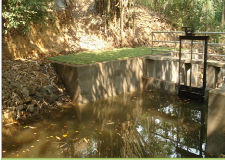
จัดสร้างฝายท่อน้ำ