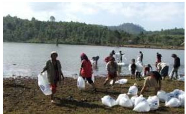
กิจกรรมปล่อยสัตว์น้ำในพื้นที่