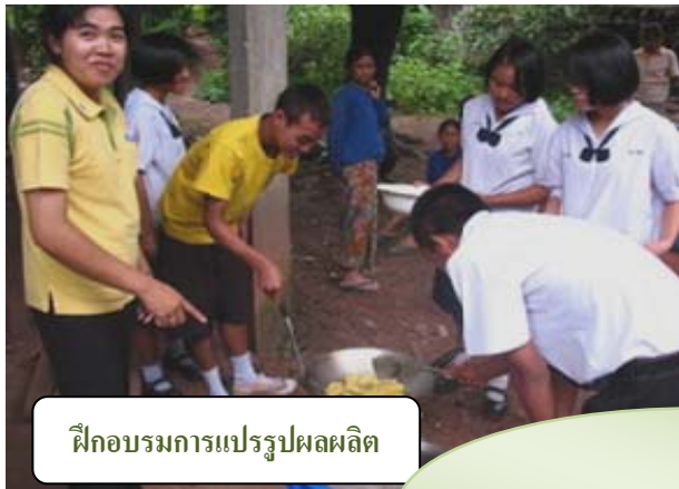
ฝึกอบรมการแปรรูปผลผลิต