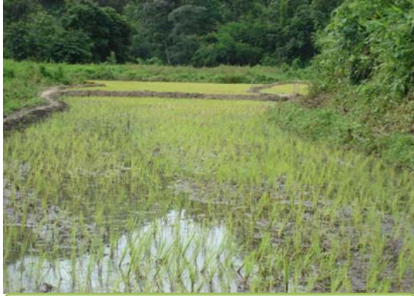
แปลงสาธิตการปลูกข้าว