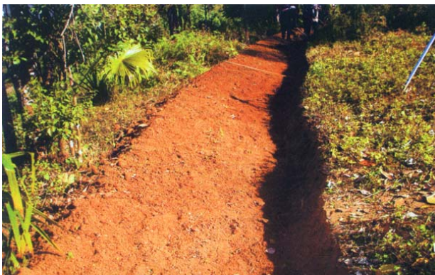
พื้นที่ที่ได้รับการจัดทำระบบอนุรักษ์ดินและน้ำ