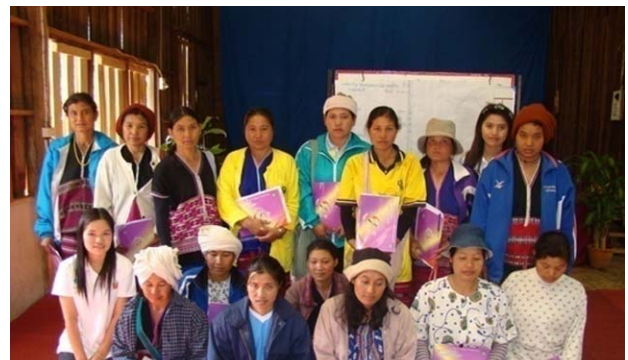
สอนการจัดทำบัญชีครัวเรือนให้กับกลุ่มข้าวซ้อมมือบ้านพะนอคี